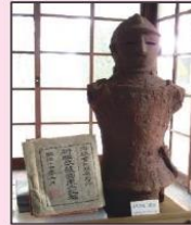
特別展示：人物 埴輪 (武装男子)